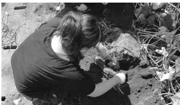
さつまいも堀りをする寮生

最近おうぎ寮では、自動車運転免許を取る子どもが3名います。現在は2週間程度で、合宿にて免許を取ることができます。その合宿に行った女の子が2名います。また、教習所に通学している男の子が1名います。世の中にある資格のなかで、一番身近な資格であり、確実な身分証となるのが自動車運転免許です。しかしその取得は、簡単ではなく、毎日の勉強や訓練なしでは取得できませんが、その分、取得した時は達成感に満たされます。将来ワーキングプアにならないように、できれば何かの資格を取得することを勧めています。その理由の1つは山を登りきったという目的達成感・満足感が得られること。2つ目はその山の乗り越え方を体が覚えると言うこと。3つ目は次に山にぶつかったときに、前回の経験を生かして自らの力で乗り越えられるという大きな自信がつくことです。これからも子どもたちの将来が、豊かで安定した生活が送れるように、様々な支援をしていきたいと思っています。