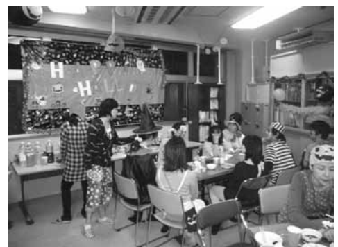
学園でのハロウィンパーティ

す。ここに感謝申し上げますとともに、どうぞ引き続き支援くださいますようお願いいたします。