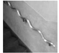
新宿寮の階段に手すりを設置、ご寄附くださった

彼が入社して約10ヶ月。はじめのうちは、1ヶ月に10日も遅刻。漢字や算数も苦手。本当にやる気があるのだろうかと頭を抱えました。社員みんなで彼が良くなることを真剣に考え、一緒に勉強していくことにしました。最近では少しずつ理解を示し遅刻も殆どなくなり、仕事も徐々に任せられるようになってきました。彼を通じて他の社員が想像力を働かせ、愛と思いやりの心が芽生えた事を嬉しく思います。今後も彼の努力と更なる成長に期待しています。